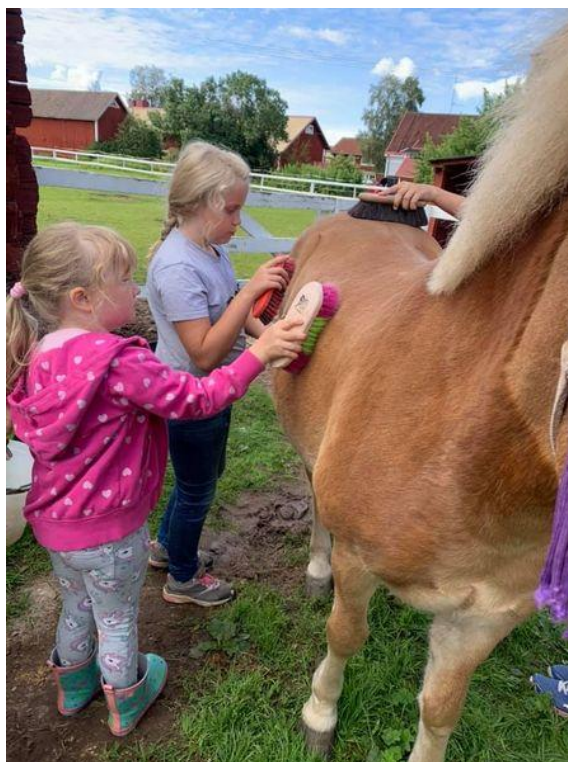
Bilder från MIRKs första sommaraktiviteter...